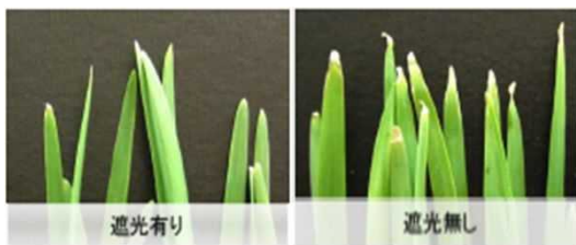
図3 葉先枯れの症状