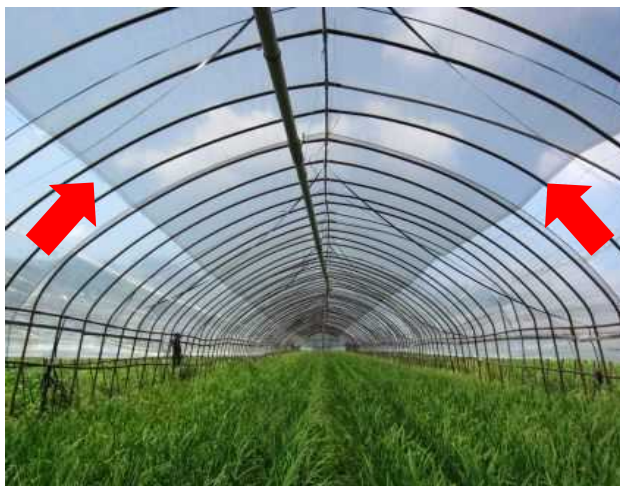
図1 天井中央部に被覆 (南北棟ハウス)