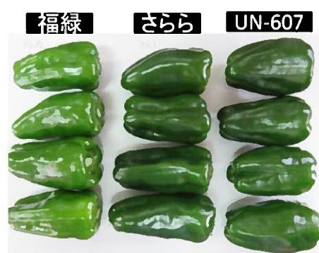
図2 品種別の果皮色